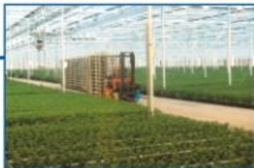
УП "Агрокомбинат «Ждановичи», Республика Беларусь