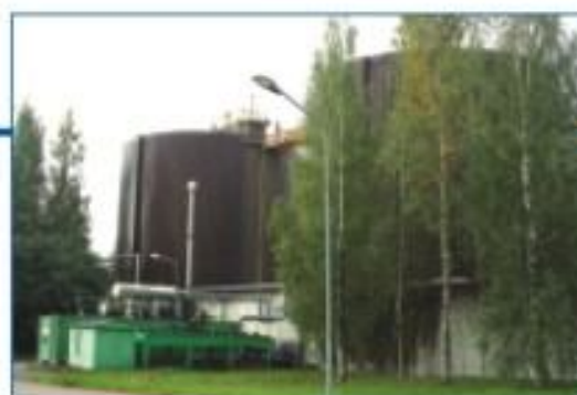
Очистные сооружения "Espoon Vesi", Финляндия