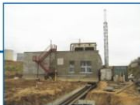
ИП «Евроопт», Республика Беларусь