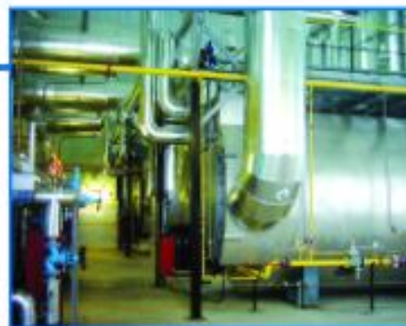
ОАО «Гродно Химволокно», Республика Беларусь

Электрическая мощность – 4 x 3 041 кВт Тепловая мощность – 4 x 3 296 кВт Электрический КПД – 42,3%